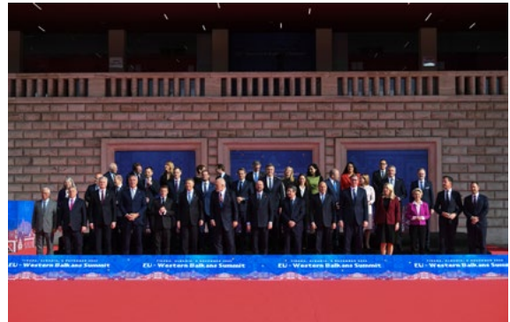
Συνόδος Ευρωπαϊκής Ένωσης-Δυτικών Βαλκανίων Οικονομική Φοιτο: Τίρανα Αλβανία, 6 Δεκ. 2022 © Ευρωπαϊκή Ένωση Credit: Link

Ατυχείς δηλώσεις, μια συγγνώμη και ο κακός καιρός