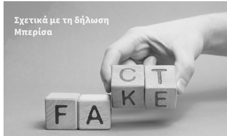
Φωτογραφία P7GPMFD © iLixe48 - Envato Elements (προσαρμογή)

«Ανοιχτή» σε ερμηνείες: Πρέπει να σημειωθεί ότι δεν παρέχεται βίντεο της συνέντευξης και το Euractiv δεν δημοσίευσε το κείμενο στα αλβανικά. Η δήλωση του Μπερίσα, όπως μεταφράστηκε στα αγγλικά και τα ελληνικά από το Euractiv, φαίνεται ότι επιτρέπει διαφορετικές ερμηνείες. Επίσης, ο Μπερίσα δεν ρωτήθηκε ποτέ για το τι εννοούσε με τη φράση «έκανε μια ισχυρή παρέμβαση», ειδικά αφού φέρεται να είπε «η Τουρκία ποτέ δεν ενδιαφέρθηκε».